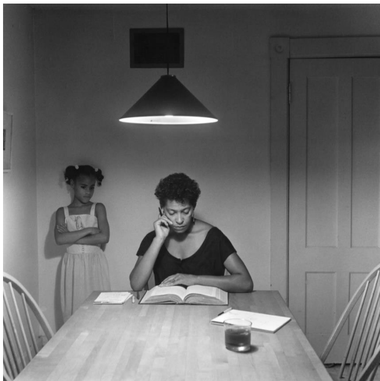
© Carrie Mae Weems, de la sèrie The kitchen table , 1990

Artista multidisciplinària, Carrie Mae Weems (Oregon, 1953) és coneguda sobretot pel seu treball fotogràfic, que desenvolupa des de fa prop de quaranta anys. L'exposició revisa cronològicament tota la seva obra i pretén subratllar la manera com l'autora fotografia amb un enfocament avançat al seu temps, projectant sempre les seves imatges cap al futur, amb un sentiment d'esperança incansable.