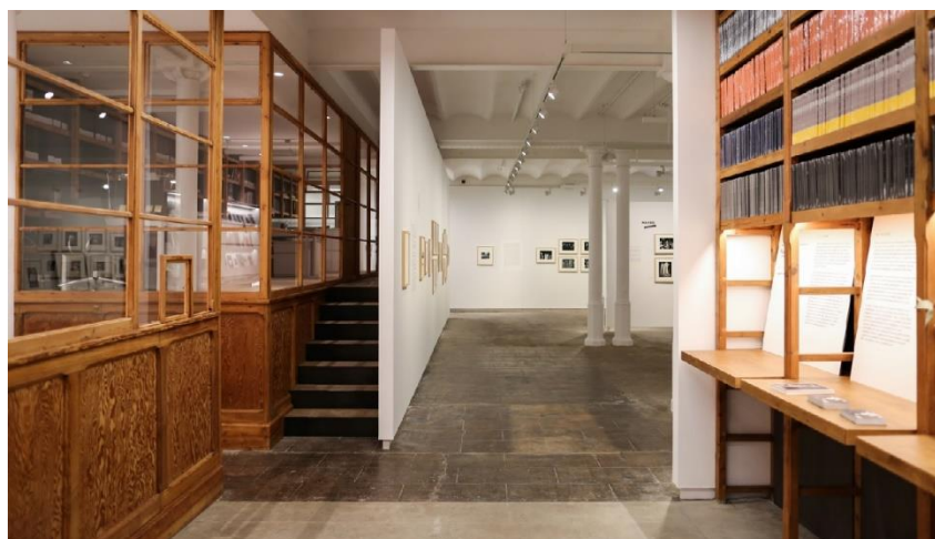
Seu de la Fundació Foto Colectania

Barcelona, febrer de 2022.- El 31 de gener de 2002 Foto Colectania obria les portes a la seu de Julián Romea amb la il·lusió d'oferir una programació que posés en valor la fotografia en les seves múltiples facetes. En aquests 20 anys de trajectòria, la Fundació Foto Colectania s'ha consolidat com un espai de referència de la fotografia i la imatge al nostre país, exercint un paper destacat en la promoció de la fotografia com a forma artística i cultural, a més d'haver estat una plataforma per a la difusió de la fotografia espanyola i portuguesa.