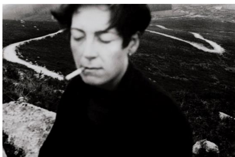
© Chema Madoz: S/T , 1990