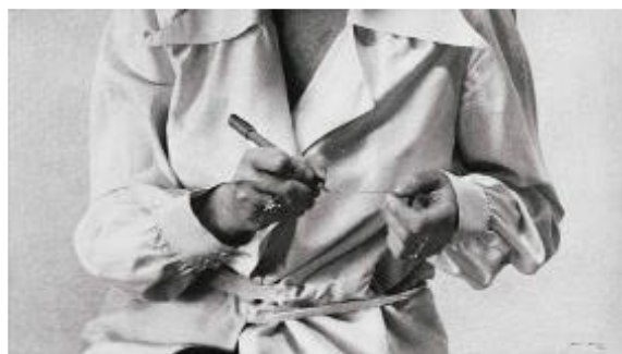
© Helena Almeida: Desenho Habitado , 1975

De les 3 exposicions que s'inauguren el 2022, aquesta té un valor especial per a Foto Colectania: tots dos autors (una portuguesa i l'altre espanyol) pertanyen a la col·lecció de la Fundació i tenen punts de trobada dins de les seves obres i processos creatius.